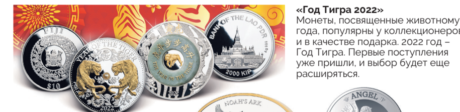
«Год Тигра 2022» Монеты, посвященные животному году, популярны у коллекционеров и в качестве подарка. 2022 год – Год Тигра. Первые поступления уже пришли, и выбор будет еще расширяться.