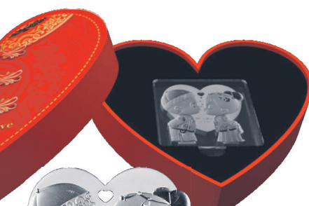
Серверная монета с романтическим посланием – чудесная идея подарка... и слов не нужно.

Повседневный ассортимент магазина сложился в ходе работы и с учетом сезонных трендов. Популярными поводами среди покупателей подарков являются рождение ребенка, дни рождения, свадьбы и другие романтические даты. Предприятия тоже все больше дарят монеты своим отличившимся работникам по случаю трудовых юбилеев.