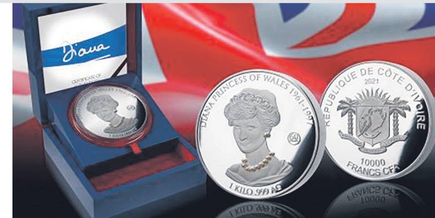
«Принцесса Диана» Серебряная монета весом 1 кг, из чистого серебра, украшенная 10 подлинными жемчужинами Акойя – дань уважения народной принцессе в честь ее 60-летия. Тираж – всего 97 монет.

В 2003 году, когда я попала в мир монет, монета традиционно была круглой. На сегодняшний день мы повидели и прямоугольные, и треугольные, и монеты других необычных форм, которые украшены драгоценными и полудрагоценными камнями, головками, микрочипами, богемским